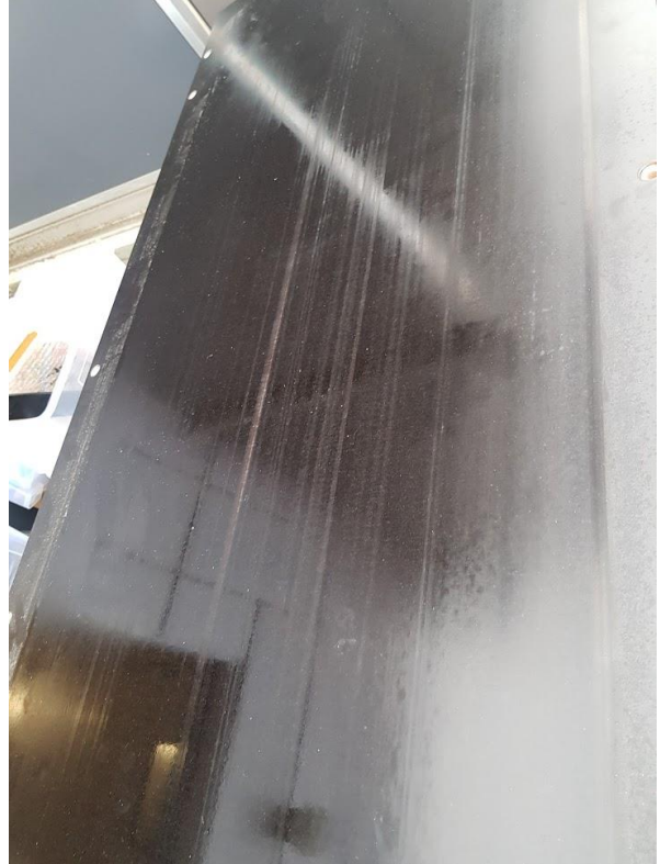
Slitt plate burde byttes snarest: