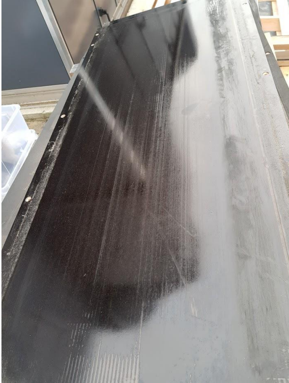
Slitt plate burde byttes: