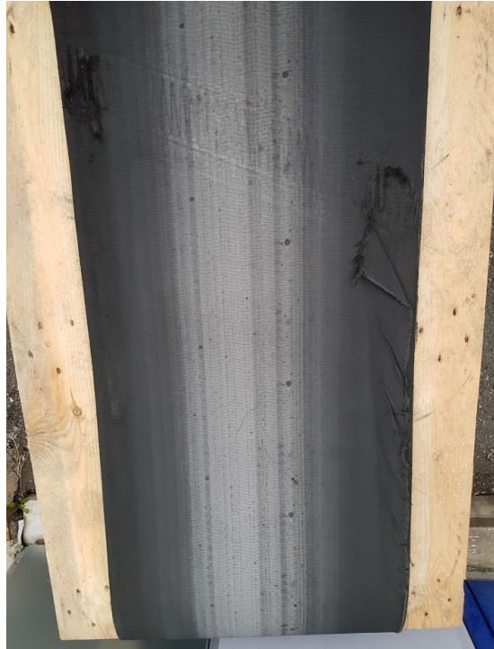
Defekt bånd må byttes: