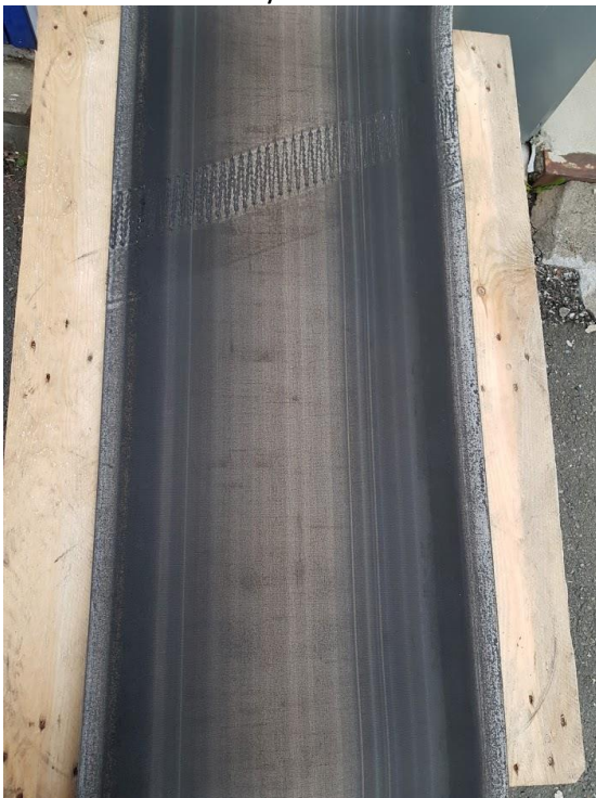
Utslitt bånd burde byttes snarest: