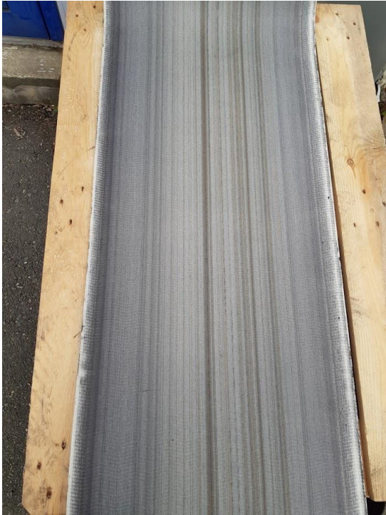
Slitt bånd: (Kan fungere en stund til)