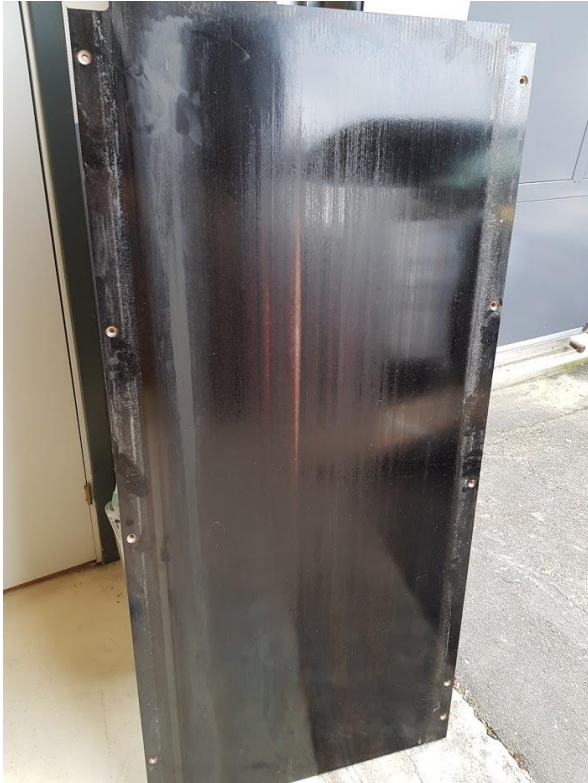
Utslitt plate må byttes: